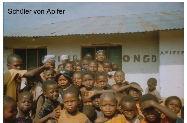
Schüler von Apifer

Schulmittel, Medikamente, medizinische Geräte und ein Funkgerät fehlen noch.